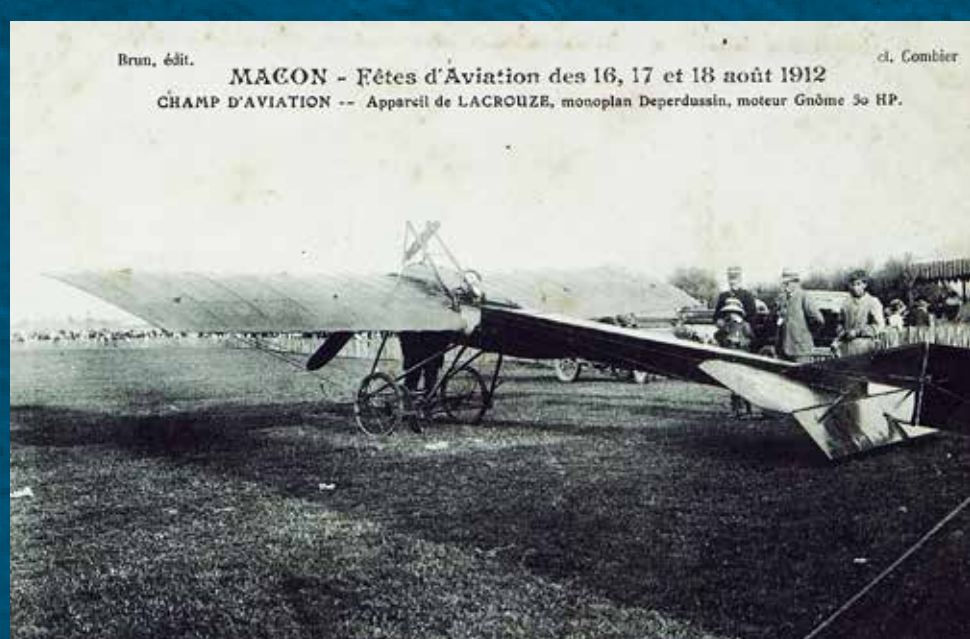
En Europe, progrès sociaux, économiques et technologiques - à l'image de l'aviation - caractérisent le début du siècle. Les démonstrations aériennes ont lieu dans toute la France. (AD71, 6F18265)