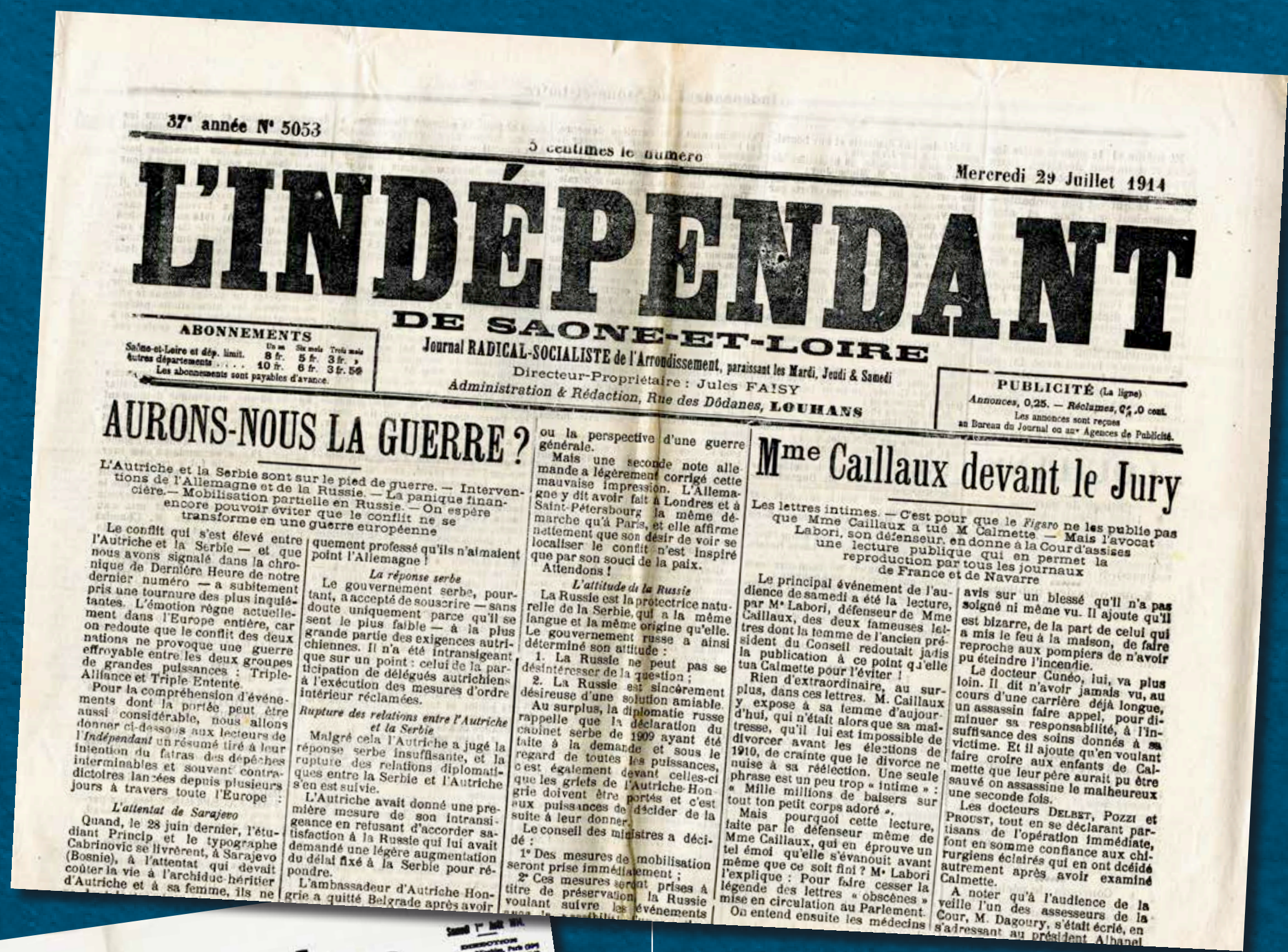
(AD71, PR 58/31)