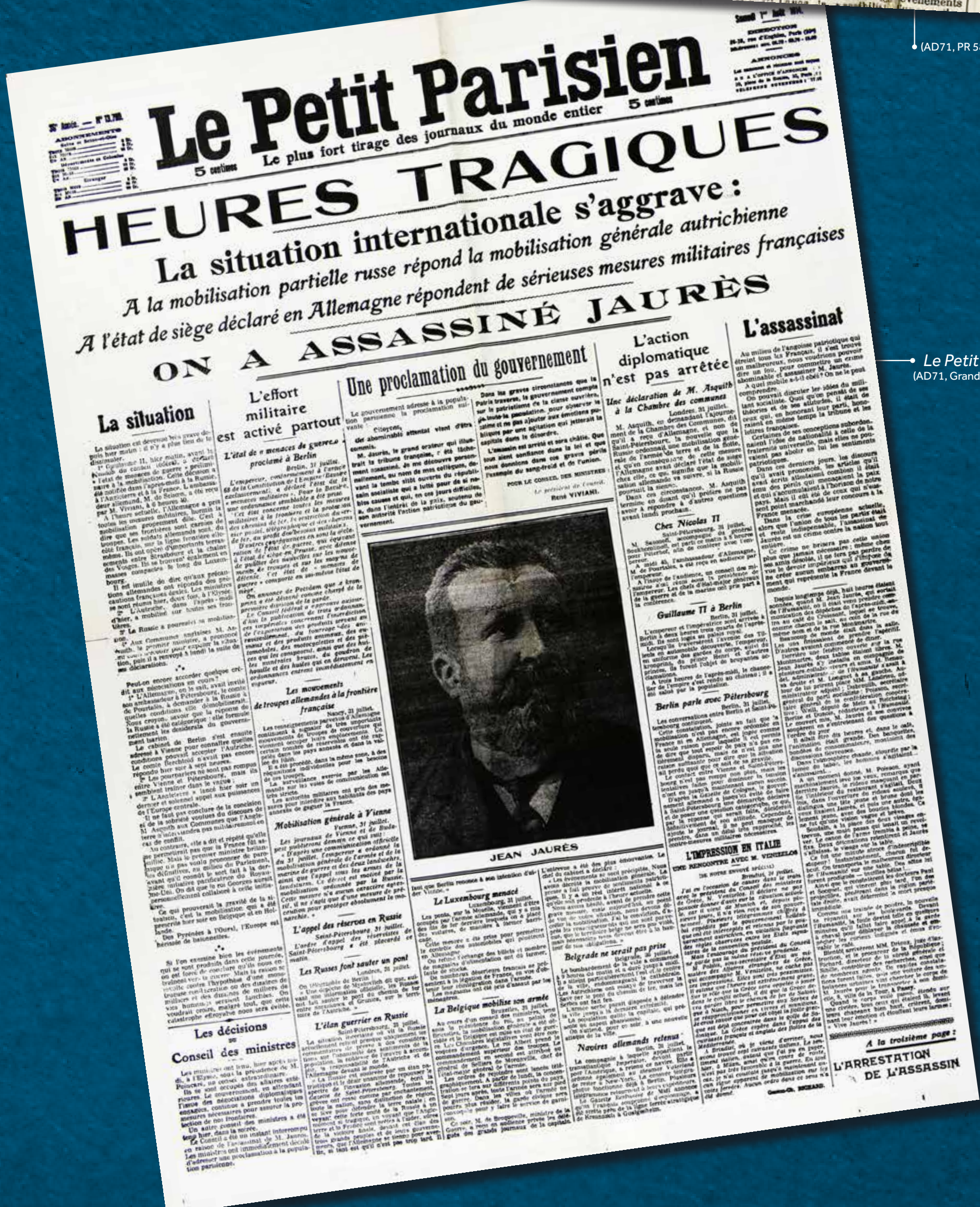
Le Petit Parisien du 1er août 1914 (AD71, Grande Collectif n° 106, 2, Boulevard)