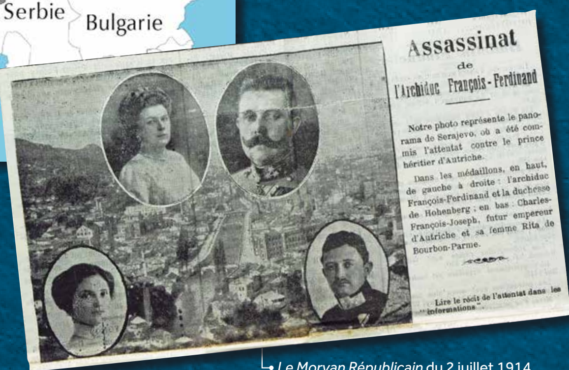
Le Morvan Républicain du 2 juillet 1914 (AD71, PR 76/17)

Le 28 juin 1914, l'attentat de Sarajevo perpétré contre François-Ferdinand, l'héritier de l'Empire austro-hongrois scelle la marche vers la guerre.